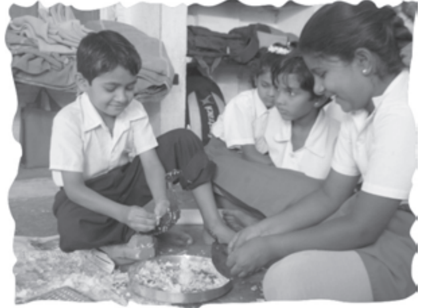
मीसुद्धा भाजी चिरतो

निंबकर शेती संशोधन संस्थेनं ९० वर्षांच्या करारावर दिलेल्या तीन गोदामांमध्ये ही शाळा सुरू झाली. ३०-४० मुलं आणि काही हजार फूट जागा, मुक्त विचार आणि गोडाऊनची प्रशस्तता, नैसर्गिकरीत्याच वर्गरचनेत झिरपली. पुढं शाळेचा विस्तार झाल्यावर आणि खोल्यांचं बांधकाम होतानाही तीच विचारसरणी अंगीकारली गेली. गरजेनुसार अधिक बांधकामही केलं गेलं. क.निं.बा.मध्ये एका रांगेत ठेवलेले बाक आणि अशा बाकांच्या तीन चार ओळी असं चित्र दिसत नाही. मुलांना बसायला खुर्च्या आणि लिहायला टेबलं आहेत. ही टेबलं कधी ओळीत, तर कधी गटात, तर कधी गोलमेज परिषदेप्रमाणं मध्यभागी मोकळी