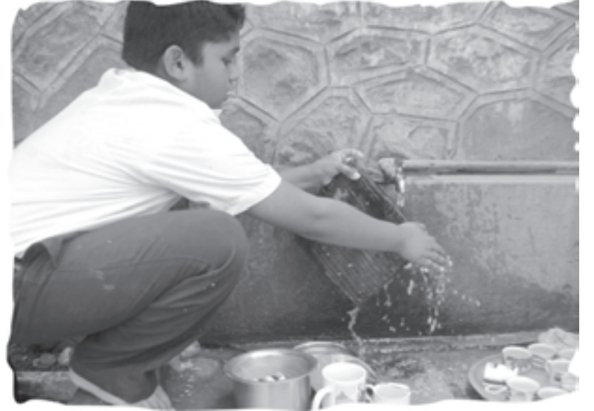
सर्वच कामं - सर्वांची !

क.निं.बा.मध्ये बालवाडीला आपली आपली अशी वेगळी मोठी जागा आहे. या जागेत गणित, भाषा, विज्ञानकोपरे, एक छोटं ग्रंथालय, मोठंसं बाहुलीघर, ठोकळे, आणि कलेच्या विविध साहित्याचाही एक कोपरा मांडलेला दिसतो. मुलं गटागटानं बसून खेळात दंग झालेली दिसतात. बालवाडीच्या ताई सर्वत्र फिरून मुलांच्या कामाची नोंद घेत असतात.