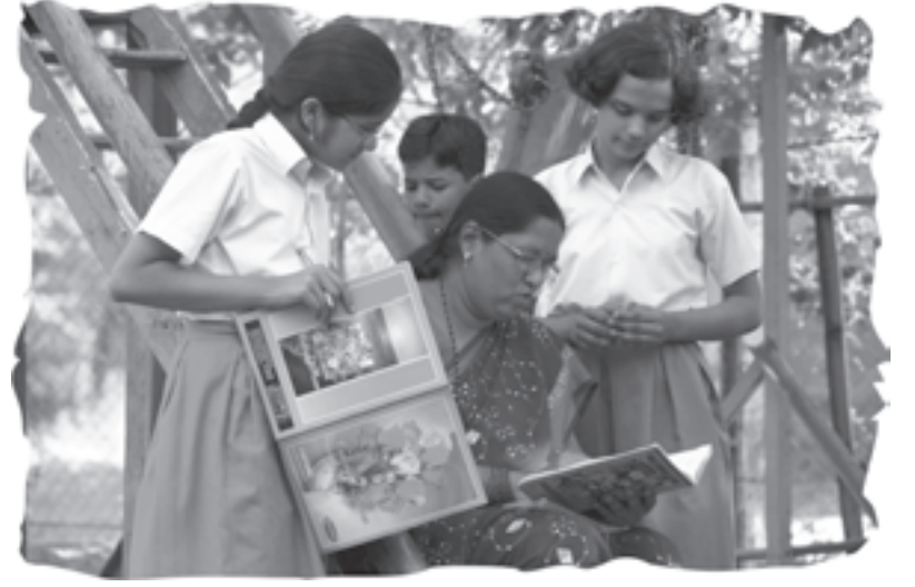
शिकणं - इथंही

टण टण टण घंटा होते. गणवेश घातलेली मुलं पळापळ करत वर्गात किंवा मैदानावर जमा होतात. लाउडस्पीकरवरून राष्ट्रगीत आणि ठरलेली प्रार्थना म्हटली जाते. पुढे उभी राहिलेली मुलं उगाच म्हटल्यासारखं करतात, मधली तोंडं हलवतात. मागची तर तेवढेही कष्ट घेत नाहीत. प्रार्थना संपताच तास सुरू होतो. शिक्षक येतात. फळ्याशेजारी उभं राहून शिकवू लागतात. क्वचित ते बाकांच्या रांगेतून फिरतात. घंटा होते. तास बदलतात. मधल्या सुट्टीच्या घंटेला मुलं पाण्याच्या लोंढ्यासारखी वर्गातून बाहेर पडतात - पळतात - धडपडतात. पुन्हा घंटा, पुन्हा तास. शेवटची घंटा, शाळा सुटते. मुलं कोंडवाड्यातून बाहेर पडणाऱ्या जनावरांप्रमाणे पळत सुटतात. जणू शाळेत डांबूनच ठेवलं होतं.